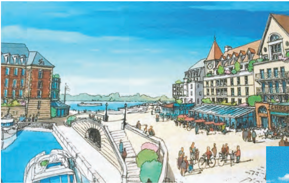
Premier visual de l'architecte du futur Port de Cormeilles-en-Parisis

La ville de Cormeilles-en-Parisis, suivie probablement par celle de La Frette-sur-Seine, a décidé de faire réaliser sur des territoires acquis ou à acquérir de bords de Seine, une Marina à l'image de celle de Cergy Pontoise sur l'Oise , mais plus importante encore. On parle de 200 bateaux ! Dans le même temps la capacité de Port Cergy passerait de 60 anneaux au même nombre ! Prenez connaissance sur internet des articles sur le sujet : « l'ancienne cimenterie LAFARGE située sur les bords de Seine, des commerces et des logements, deviendra un port de plaisance. Les 22 ha de terrains ont été vendus à Bouygues immobilier. Il est prévu de 1000 à 1200 logements dont 25% de logements sociaux » ... Bref, du sensationnel après la forte croissance des activités du nouveau quartier des bois Rochefort (100 ha), c'est la folie des grandeurs qui s'est emparée de Cormeilles qui veut réaliser une « côte d'azur » en Seine ! Une frénésie pour l'implantation des ports de plaisance fluviaux !