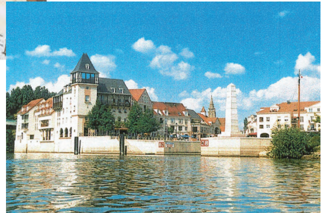
L'Entrée du Port

C'est peut-être parce que le Maire Jacques Myard envisagerait en cas de fermeture de l'hippodrome de faire réaliser lui aussi la marina de « Port Maisons-Lafitte » 2000 logements neufs avec 25% de logements sociaux... Il est déjà en pâmoison, le triomphe d'une carence passée !