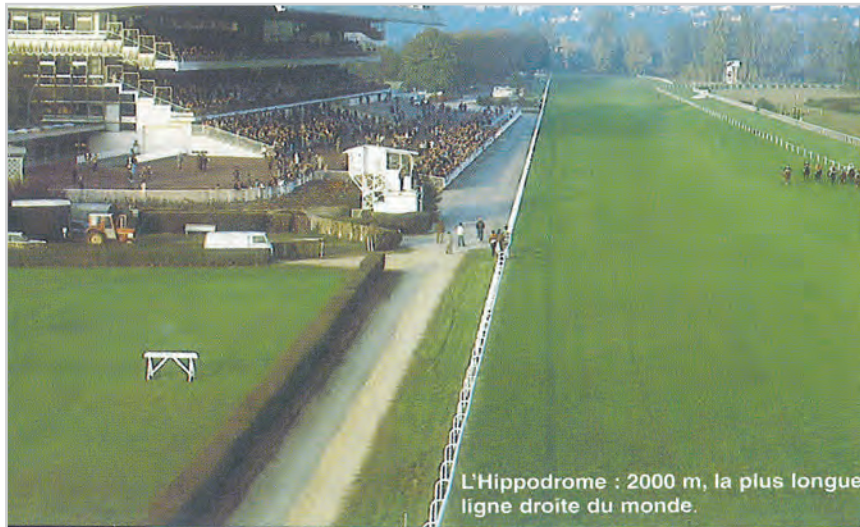
L'Hippodrome : 2000 m, la plus longue ligne droite du monde.