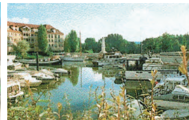
Le Port de Cergy